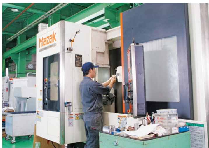
INTEGREX J-200(ヤマザキマザック)