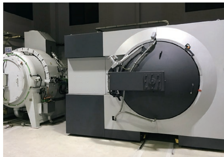
真空熱処理炉(協力工場)