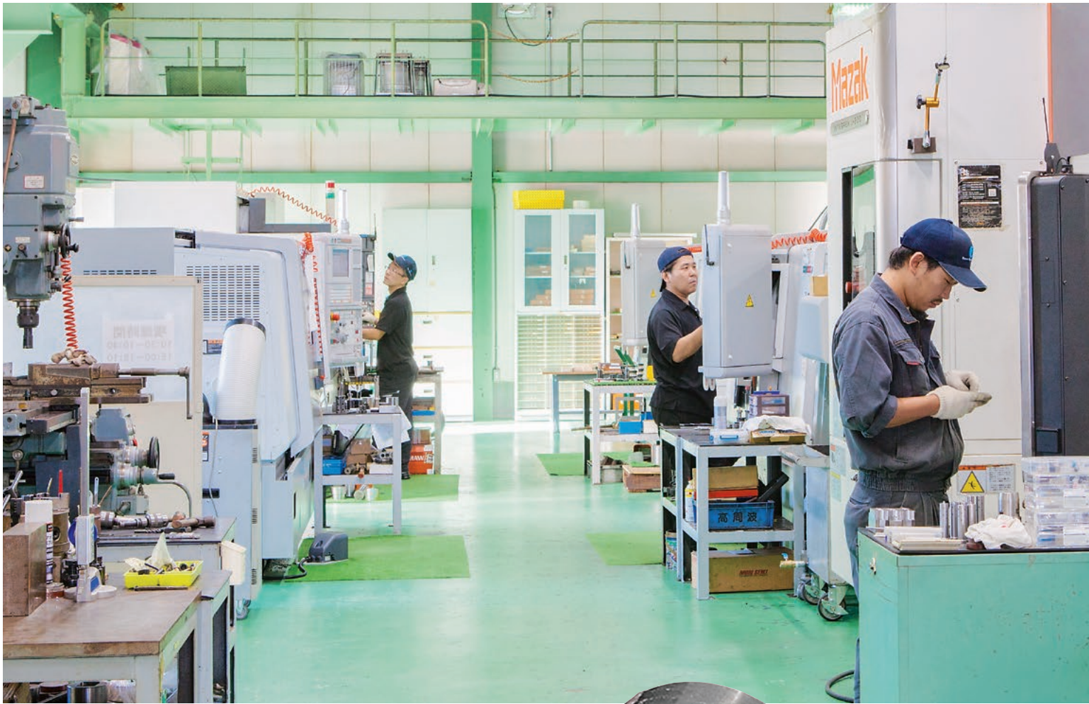
メカテック本社工場